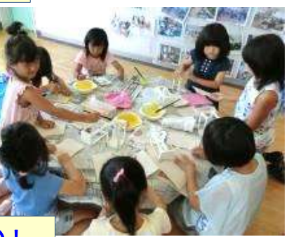
灯籠 絵かき 作業:児童の色使いは素晴らしい！