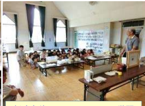
紙すき前に ケナフについて学習