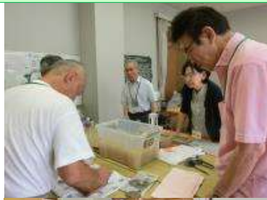
北区・小部児童館で行う 灯笼づくりの準備作業を行いました。 ご協力ありがとうございました!