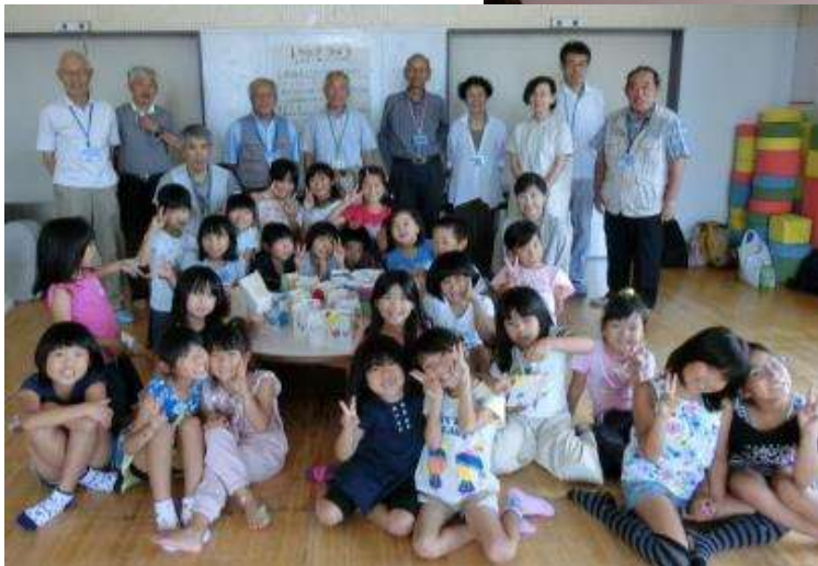
記念撮影をしました!