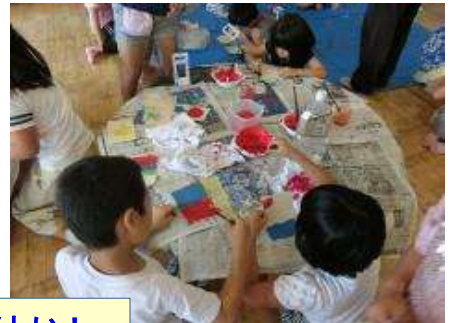
灯笼 絵かき 作業: 児童の色使いは素晴らしい!