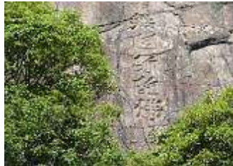
旅人の安全を祈願した妙号岩