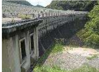
国の有形文化財の立ヶ畑堰堤