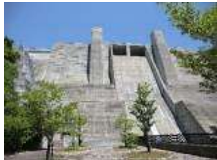
平成20年完成の石井ダム