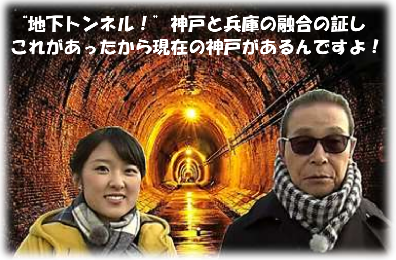
近代化産業遺産 湊川隧道（明治34年完成）