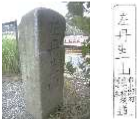
烏原古道 丹生山への道標

平清盛が丹生山へ毎月必ず月詣をしたと伝えられている烏原古道を歩き、明治38年神戸水道創設時造られた国の有形文化財の立ヶ畑堰堤（烏原貯水池）と、NHK「フラタモリ・神戸の街“神戸はなぜハイカラ！”」で紹介された近代化産業遺産「湊川隧道」を巡ります。