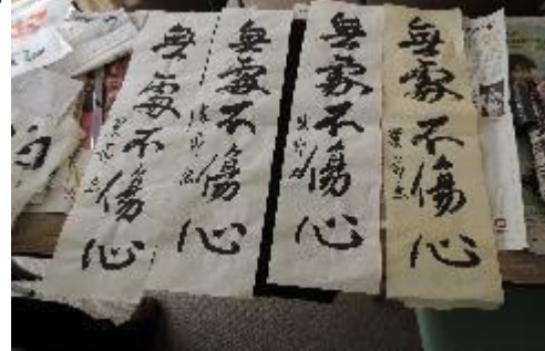
とんやあ〜 女心して読れるて