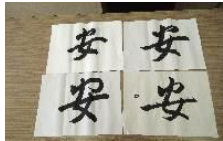
仁子殿の書・・・書道の会のハンフ掲載 桐嵐！