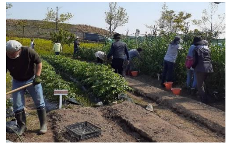
有機農法を考える会