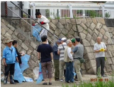
東灘区会 住吉川清掃活動