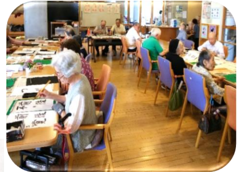
中央区会 高齢者施設での習字指導