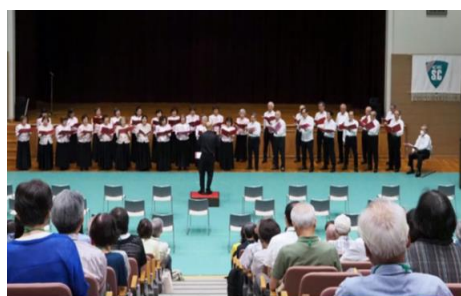
混声合唱団コーロ KSC