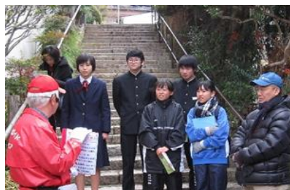
有馬観光ガイドボランティア