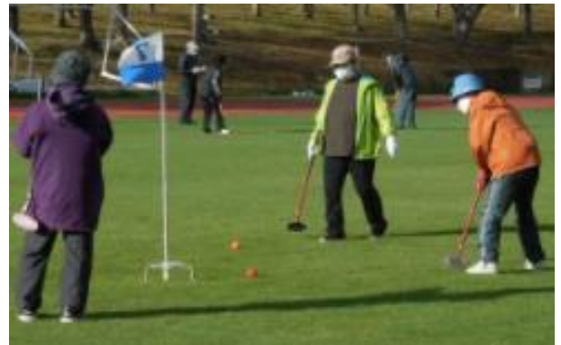
会員親睦 グラウンドゴルフ大会