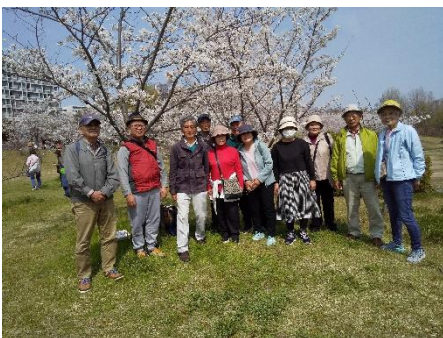
兵庫区会 西神中央での花見