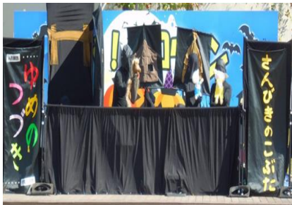
人形劇「ゆめのつづき」