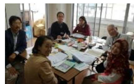
PHD 協会支援(日本語学習支援)