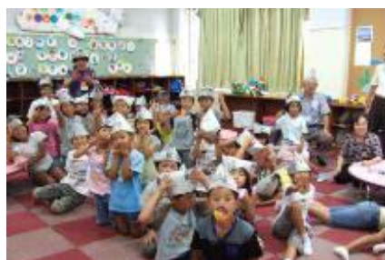
むかしあそび研究会