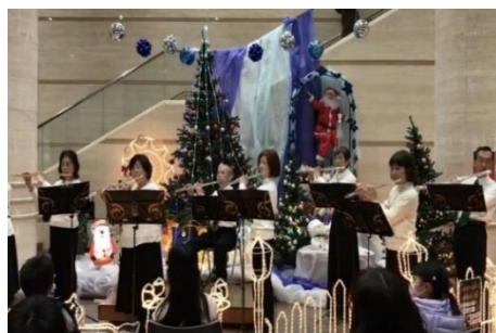
フルーツクラブ・ジークレフ