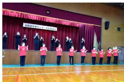
KSC 手話ソング同好会