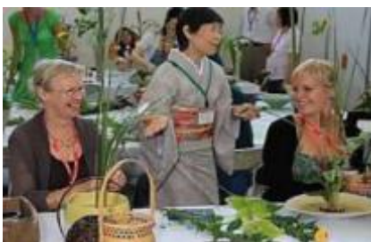
国際部会行事グループ(日本文化の紹介)