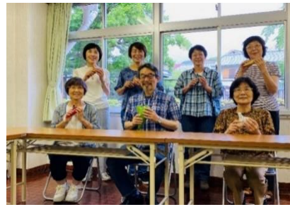
KSC オカリナあまーびれ