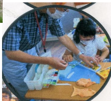
灘区会 特別支援学校の学習支援