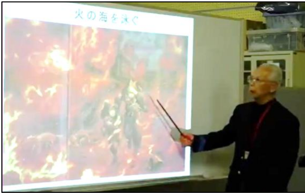
戦争と平和 語り部