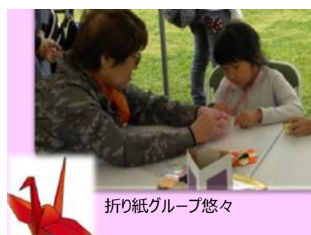
折り紙グループ悠々