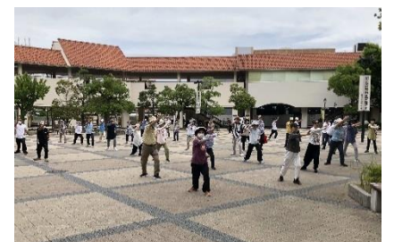
太極拳ゆったり体操