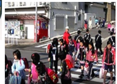
北区会 地域での通学見守り