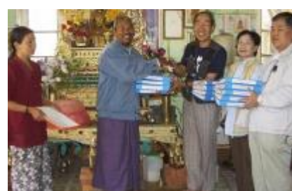
英語点字活動支援