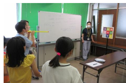
KSC スポーツ吹矢グループ