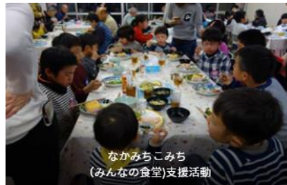
なかみちこみち (みんなの食堂)支援活動 みんなの食堂「なかみち・こみち」