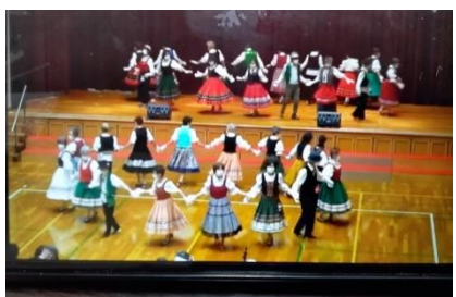
すみれ (フォークダンス)