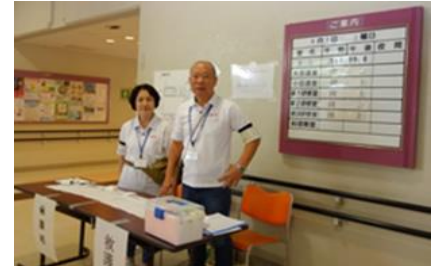
救急ボランティア OB 会