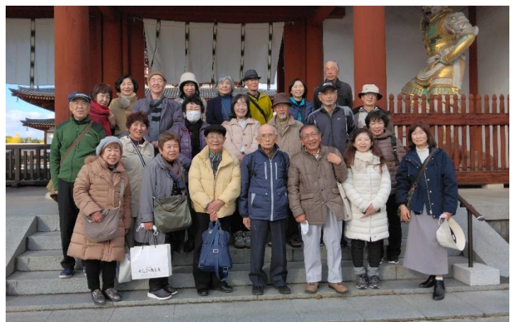
薬師寺で集合写真