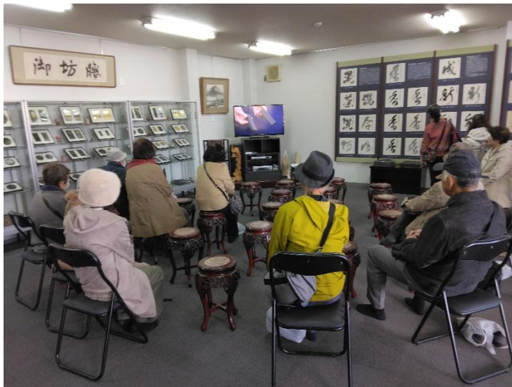
ビデオを見てお勉強