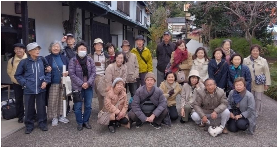
墨運堂さんで集合写真