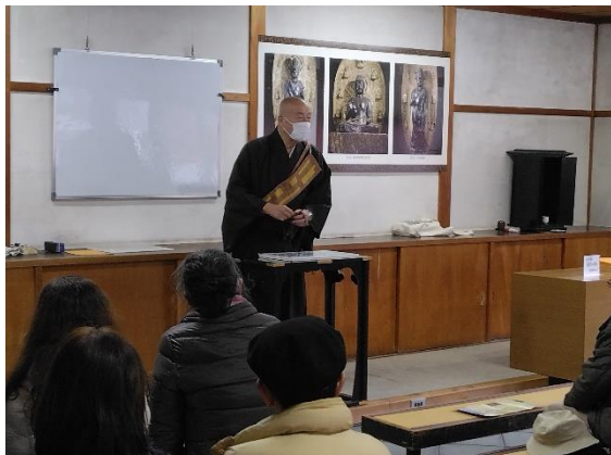
薬師寺で「法話」を聞く