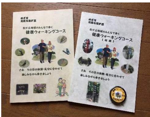
写真1：地域健康ウォーキング コース案内<2編発刊 数冊残つ

私もその一人で、地域活動として多井畑小学校の「のびのび広場」を通じて、数年前から3月に卒業生全員へ、卒業記念として“飛びたて多井畑っ子”のメッセージを貼り付けた手製の【卓上竹トンボ】{写真2}を進呈する活動を続けています。子どもたちからは「ちょっと不安でしたが元気が出ました。胸を張って卒業し中学校でも頑張ります」「大人になったら私も地域の人たちにボランティアをします」など、毎年素晴らしいお礼のメッセージ集が届き、元気をもらっています(写真3)。私は、年が明ければ85歳のおじいさん そろそろボランティアも終活かな。