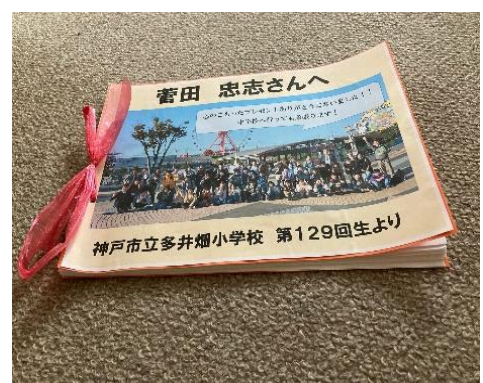
写真3：卒業生からのメッセージ集