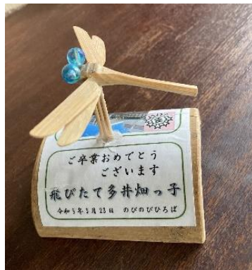
写真2：卒業記念の卓上 竹トンボ